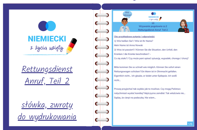
materiał do pobrania w .pdf