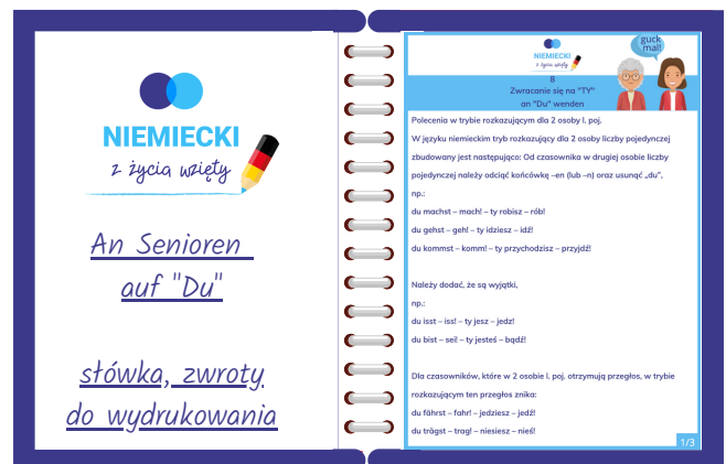
materiał do pobrania w .pdf